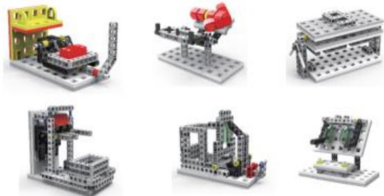
Kit de construcción de pruebas de competencia para entrenamiento